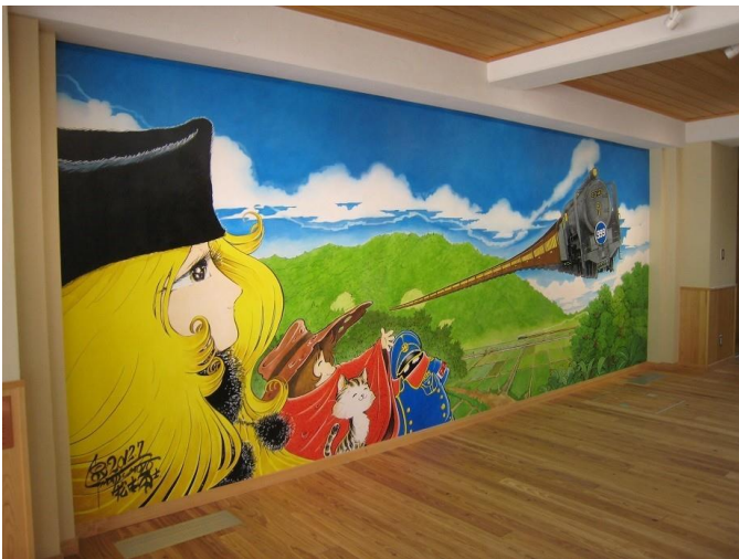
壁画 ふるさとからの旅立ち

漫画家松本零士氏と新谷との繋がりを活用し、新谷地区の町おこしを図ろうと平成25年2月「新谷一万石まちおこしの会」が設立された。そこで何ができるか、平成25年度に実施できる関連事業を立案した。しかし予算はゼロに等しい中での立案であり苦しい思いがあった。計画の一つ目として、松本零士先生の作品「銀河鉄道999」にちなんだイラストを募集し、「ふるさと祭り」の前日、零士先生に集まったイラストの審査をお願いした。次に7月の新谷商工会実施の夏祭り「ふるさと祭り」の会場では集まったイラスト45点の審査の結果発表が行われた。イラストは大洲はもちろん、松山、八幡浜、内子などから主人公の鉄郎やメーテル、999号などの力作が集まった。