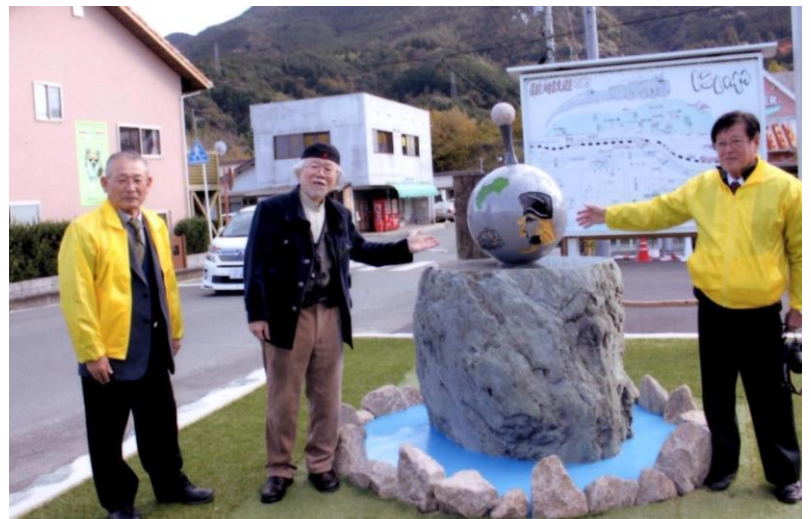
松本零士先生 記念碑