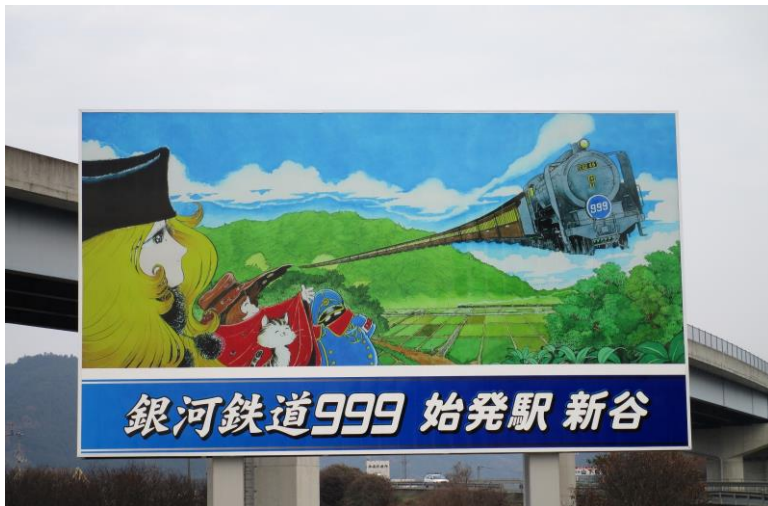
国道 56 号線沿い 松山方面

全国の「銀河鉄道999」ファン、零士ファンの皆さん、愛媛県大洲市新谷に松本零士「銀河鉄道999」の新たな聖地が誕生しました。ぜひ、お越しく下さい。