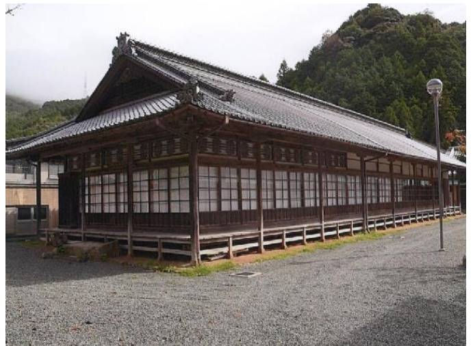
旧新谷藩陣屋 麟鳳閣 (りんぼうかく)