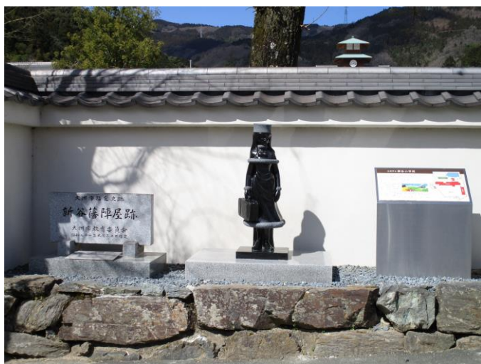
新谷小学校前 メーテル像

この会話は1944年（昭和19年）お二人が柿の木の上で交わした実際の会話である。零士先生の自伝的アニメ「昆虫国漂流記」の中にもタクちゃんの名称で度々登場する。