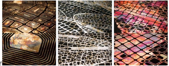
せ <世界的なデザイナーcosmos 内田喜基氏デザイン壁紙シリーズ>