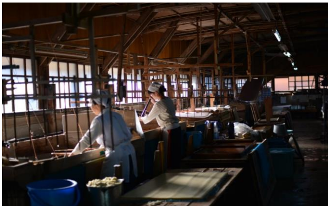
<愛媛の伝統工芸大洲手漉き和紙>

もともと IT スキルを生かした起業を考えておりましたが、国の指定する伝統工芸大洲手漉き和紙の産業復興及び新たな和紙装飾の可能性“ギルディング”の出会いがデジタルからアナログの仕事への変換のきっかけでした。