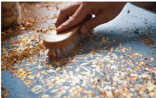
<ギルディング装飾>

ギルディングとはヨーロッパの金属箔装飾技法。古くは額の装飾に使われていましたが、私の師匠ガボー・ウルヴィツキがギルディングの紙への装飾に成功、彼の会社はフランスでは国家遺産企業に認定されてます。