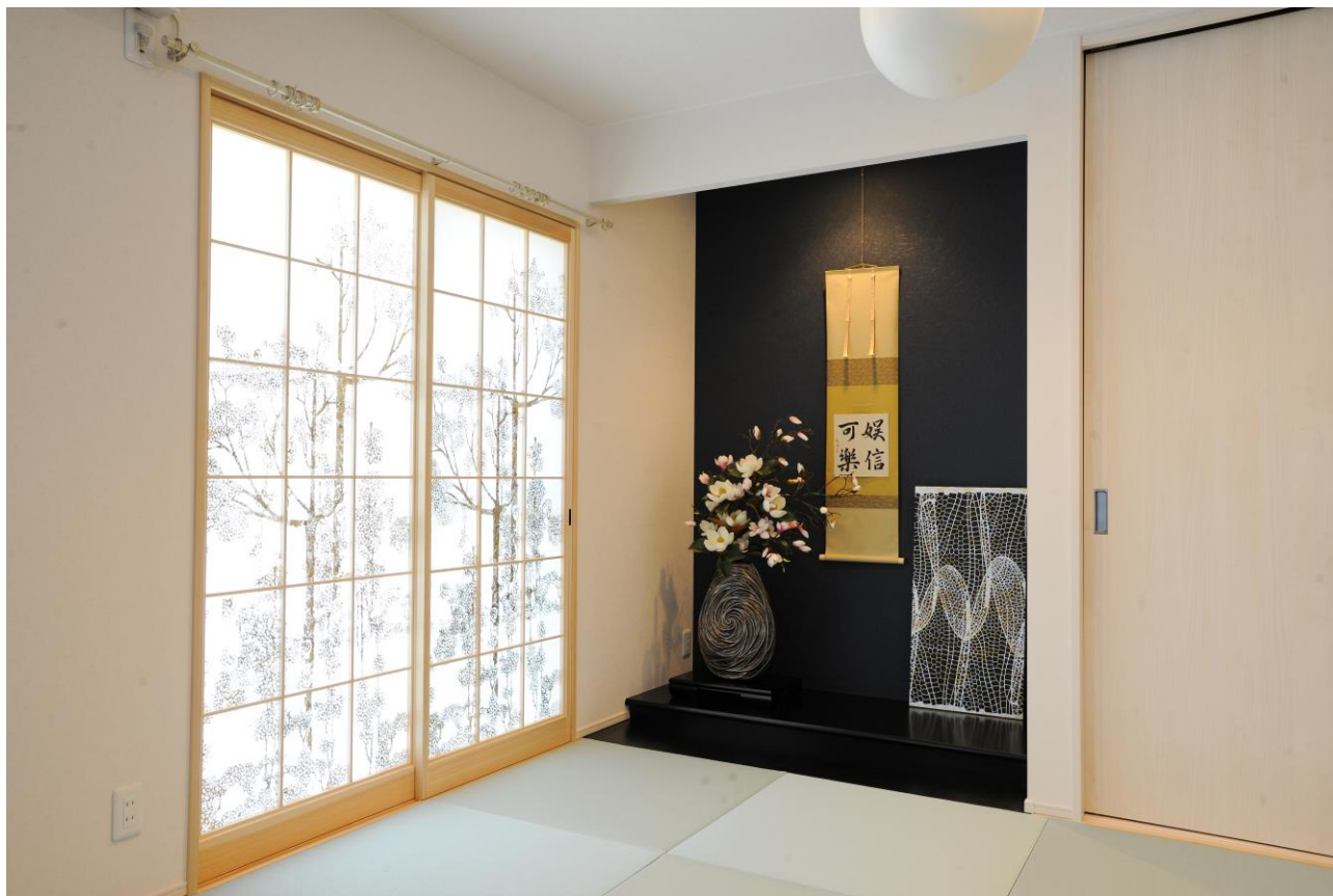
< 亀岡邸の障子/五十崎社中作品 >