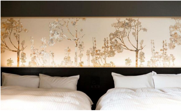
<道後温泉ホテル ギルディング和紙壁紙施工>