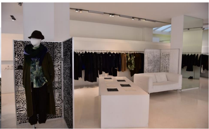
<2017年フランス ヨウジヤマモト店舗への和紙インスタレーション パリデザインウィーク>