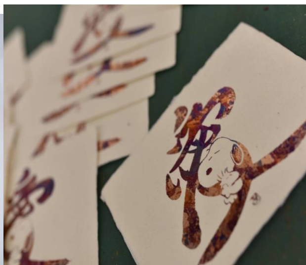
<スヌーピーとのコラボ葉書>