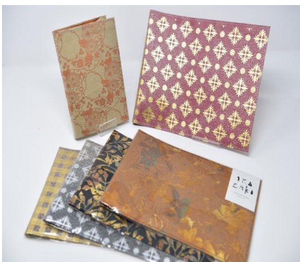
<ブックカバー、ポストカードなどのステーションナリー類>