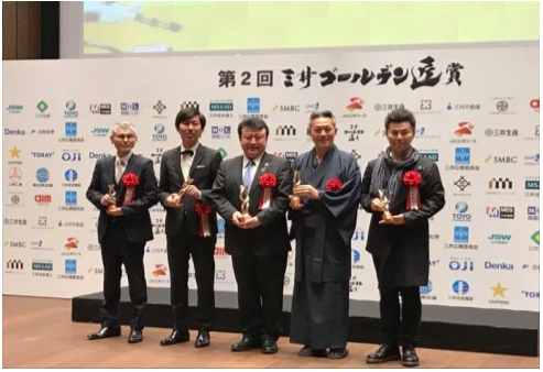
<第2回三井ゴールデン匠賞 受賞>