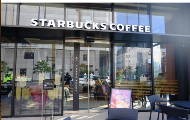
<松山市駅横スターバックス店ギルディング和紙パネル施工>