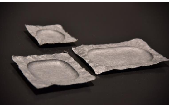
<2015年ミラノ国際博覧会日本館にて nendo 佐藤オオキ氏デザイン和紙皿展示>