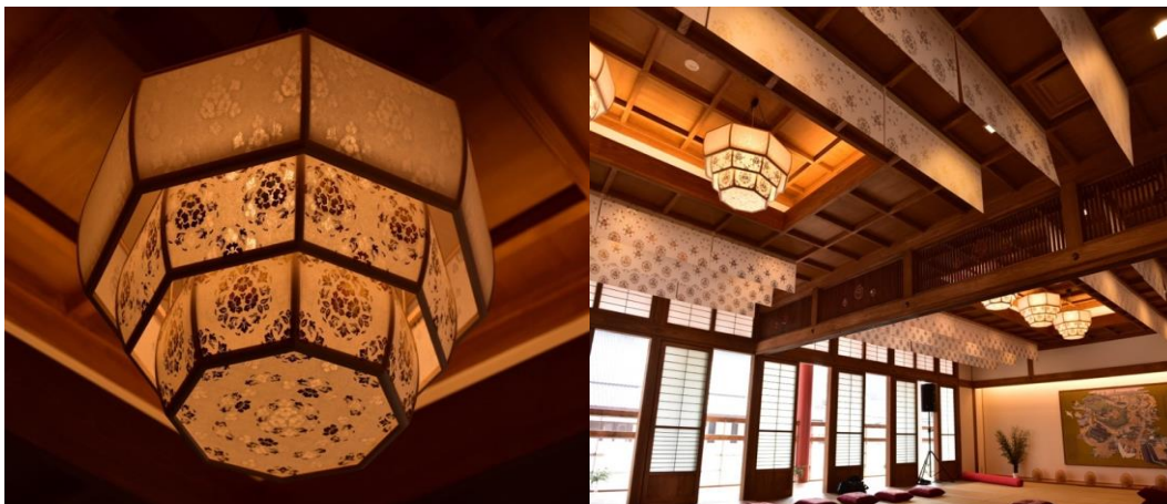
<道後温泉 飛鳥乃湯 ランプシェード及び天吊シェード>

机一つ、ゼロからのスタートでしたが、商工会はじめ周りの皆さんの協力もあり商品開発後は積極的に国内外展示会へ出展。フランスの世界最大級展示会メゾン&オブジェは3年連続、そして国内最大級展示会東京ギフトショーはほぼ毎年出展する事によりだんだんと取り扱い頂く機会も増えてまいりました。