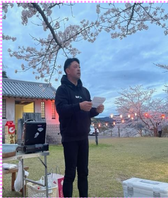
会長あいさつ中 設営準備もおつかれさまでした

終了後、これも久しぶりのカラオケ道場がパスタタイムで開かれた。道場主を初め9名の参加者がプロ顔負けの歌声を披露していた。移動例会、カラオケ道場とコロナ感染以前に戻ったと感じ、ウィズコロナの時代が来たのだと思わせた花見例会であった。