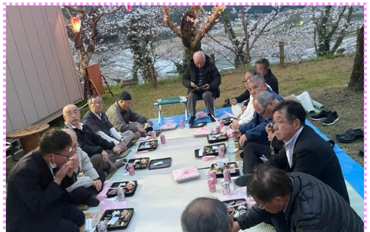
この日は熱爛がよく出ました！