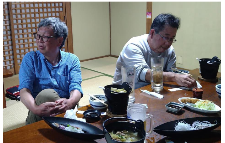
反省会での委員長 あいさつ