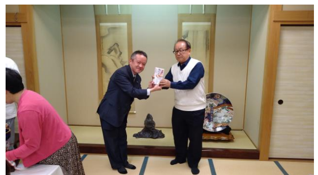
勝利金はロータリーに