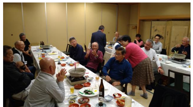
和気あいあいの懇親会