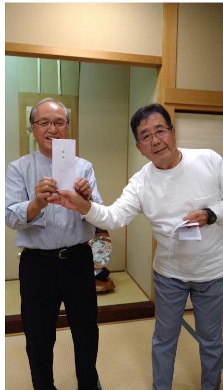
LC 同好会戦優勝者・・・私でした

：洲ゴルフ倶楽部 競技日 2023/10/26 (木) I位判定 ネット合計値 競技方法 ダブルペリア HDCP上限 男性36.0 女性36.0 優先順位 なし 隠しホールOUT ①②③④⑤⑥⑦⑧⑨ IN ⑩⑪⑫⑬⑭⑮⑯⑰⑱