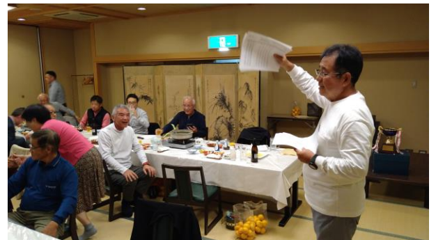
富永世話役による成績発表