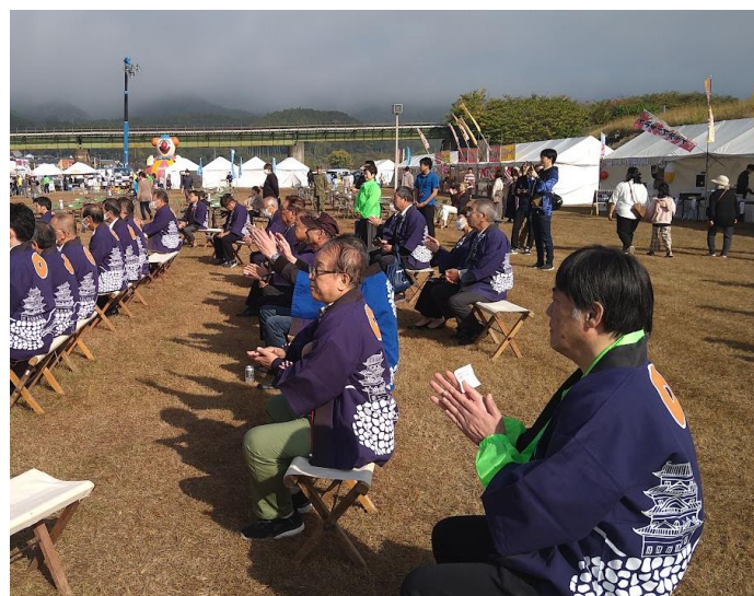
会長も開村式参加