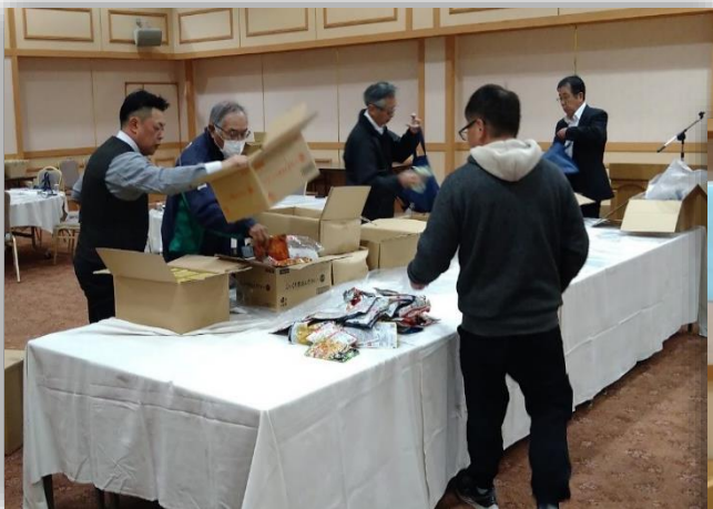
段ボール 20 箱分の参加賞、重かったなあ～(ー_ー)