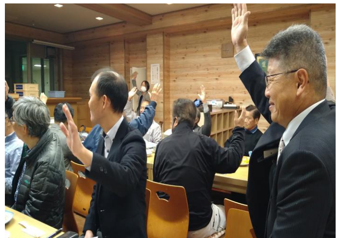
「クラブ活動楽しんでいる人？」 「ハイ！！」