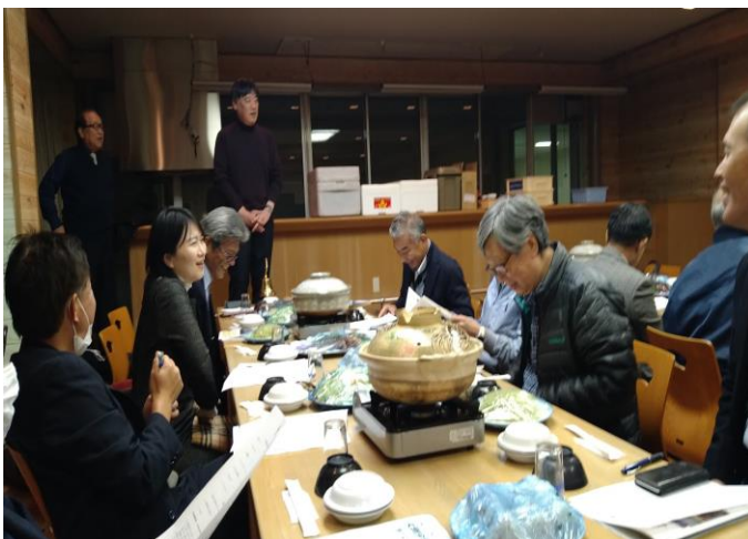
渦尻会長 あいさつ