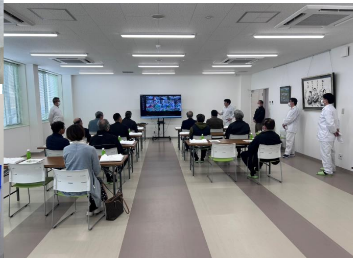
衛生服に着替えて、工場内へ