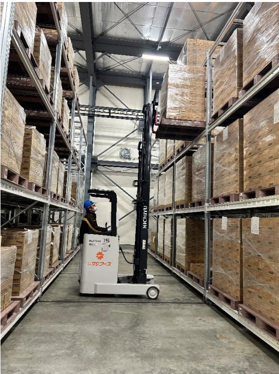
まるで要塞のような倉庫