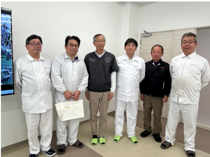
今回、お世話になった職員の皆様

また、巨大な倉庫には天井高くまで、びっしりと段ボールが規則正しく並び、フォークリフトが滑るように製品を運んでいます。ここは日々の食卓に“すぐに食べられる安心”を届けるための、膨大なストックが眠る静かな要塞の様でした。