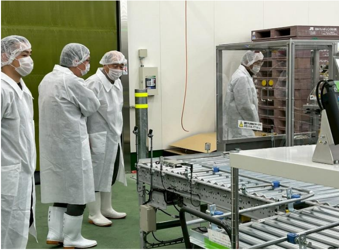
最新鋭の機器に興味津々のメンバー