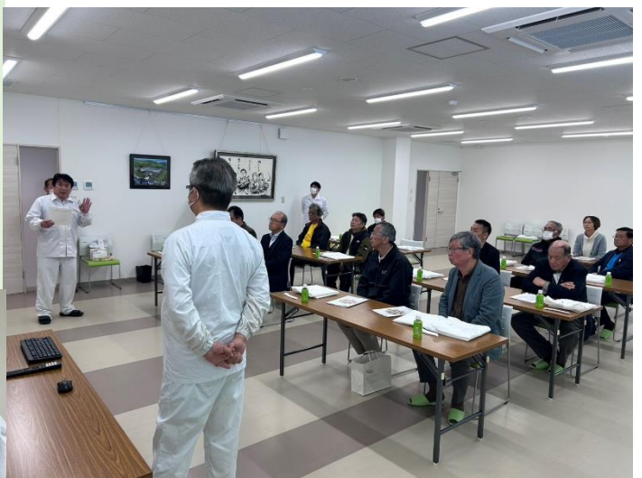
食品が出来るまでの工程に、なるほど、なるほど・・・